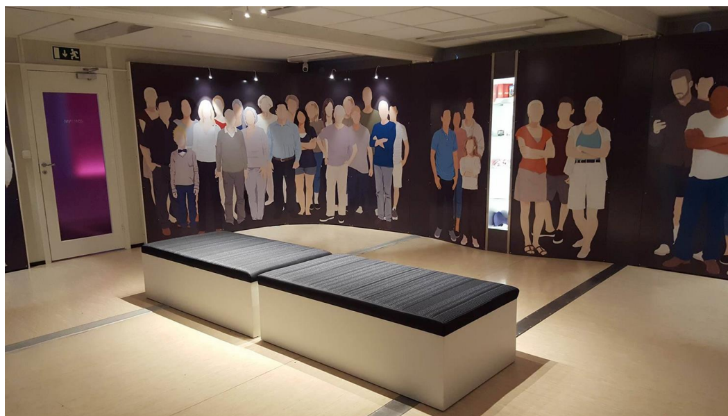
VESTAGDERMUSEET VI FORTELLER DIN HISTORIE