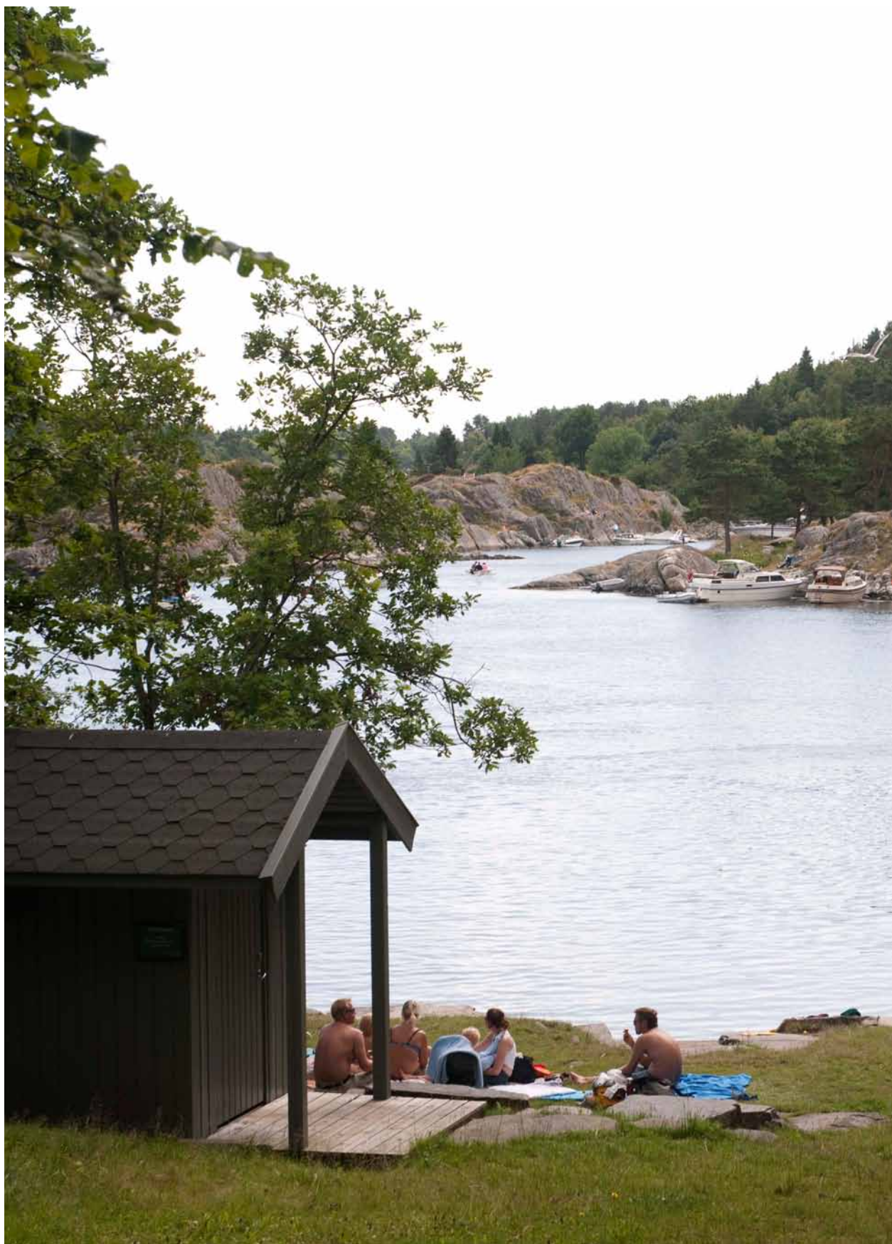
Kommuneplan- bestemmelsen tillater toalett, brygger og turstier til bruk for allmennheten på badeplasser og i turområder ved sjøen.