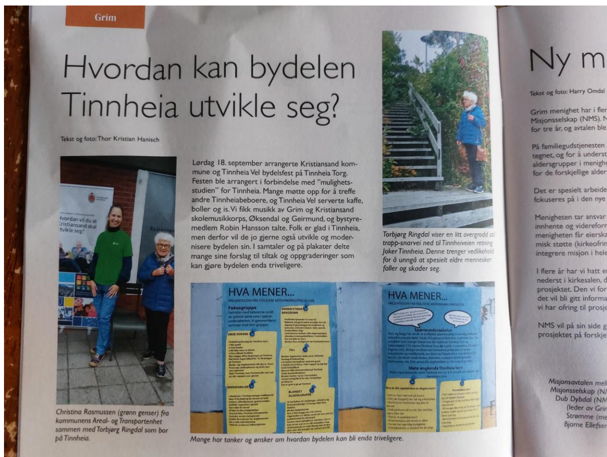
Figur 2: Utklipp fra Grim menighetsblad

https://www.fvn.no/nyheter/lokalt/i/0GLqM0/bydelsfest-for-tinnheia-et-godt-sted-aa-vokse-opp og i Grim menighetsblad (se bildet):