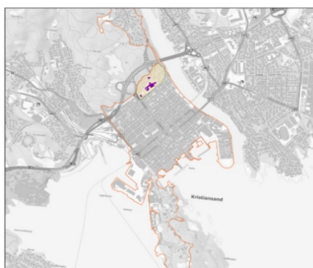
Bilde 2. Avgrensning områdesatsing