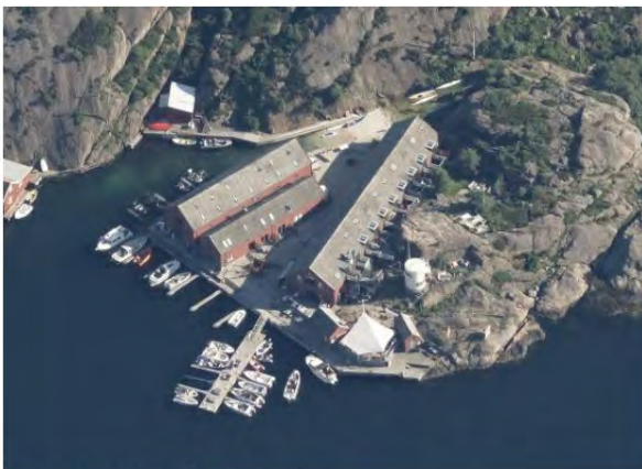
Figur 1 - Verftet

For å sikre næringsdriften på Kapelløya legger forslag til endring opp til å forankre restaurant, konferanselokale og utleieleilighetene i plan. Det er foreslått at utleieleilighetene skal utleies gjennom et felles driftsselskap i minst 9 måneder i året. Det er lagt inn i bestemmelsene at bryggene skal være åpne for fri ferdsel, og at det ikke tillates innretninger som hindrer fri ferdsel, for å sikre allmenhetens tilgang. I tillegg er byggegrenser, høyde og utnyttelse regulert inn, da dette ikke var innregulert i gjeldende reguleringsplan. Det er tatt utgangspunkt i oppførte/eksisterende tiltak.