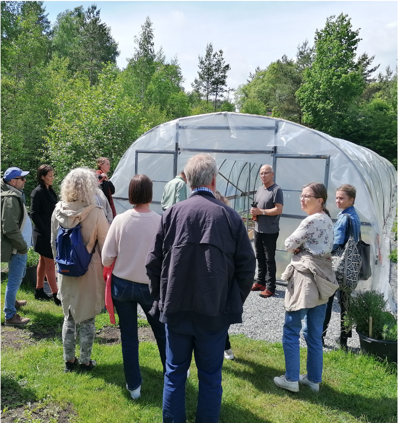
Kunnskapsformidling er en viktig del av virksomheten i Kristiansand andelslandbruk. Ikke bare til egne medlemmer, men også til interesserte besøkende som vil lære mer om både dyrking og hvordan dyrkingsfellesskapet er organisert.