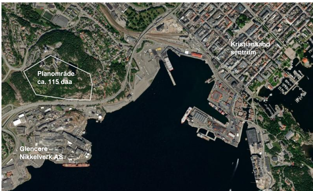
Figur 1 Oversiktskart. Området ligger ca. 1 km vest for Kristiansand sentrum.

Planområdet ligger i fjellet under Dueknipen i Kristiansand kommune ca. 1 km vest for Kristiansand sentrum. Sør for planområdet ligger Glencore Nikkelverk AS.