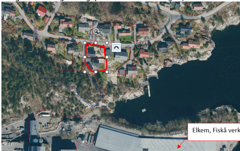
Figur 1: oversiktsbilde, planområdet markert med rødt

Konsul Wilds vei 20 A var opprinnelig bygd med en enebolig og regulert til boligformål i reguleringsplanen for Fiskåtangen, vedtatt 14.05.1960.