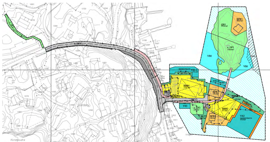
Figur 1. Kartutsnitt, reguleringsplan for Vraget - Flekkerøy, vedtatt 16.09.2015, endret 09.06.2022.

Utbyggingsavtale for Vraget - Flekkerøy By- og stedsutviklingsdirektøren - avtaleutkast datert 30.09.2022