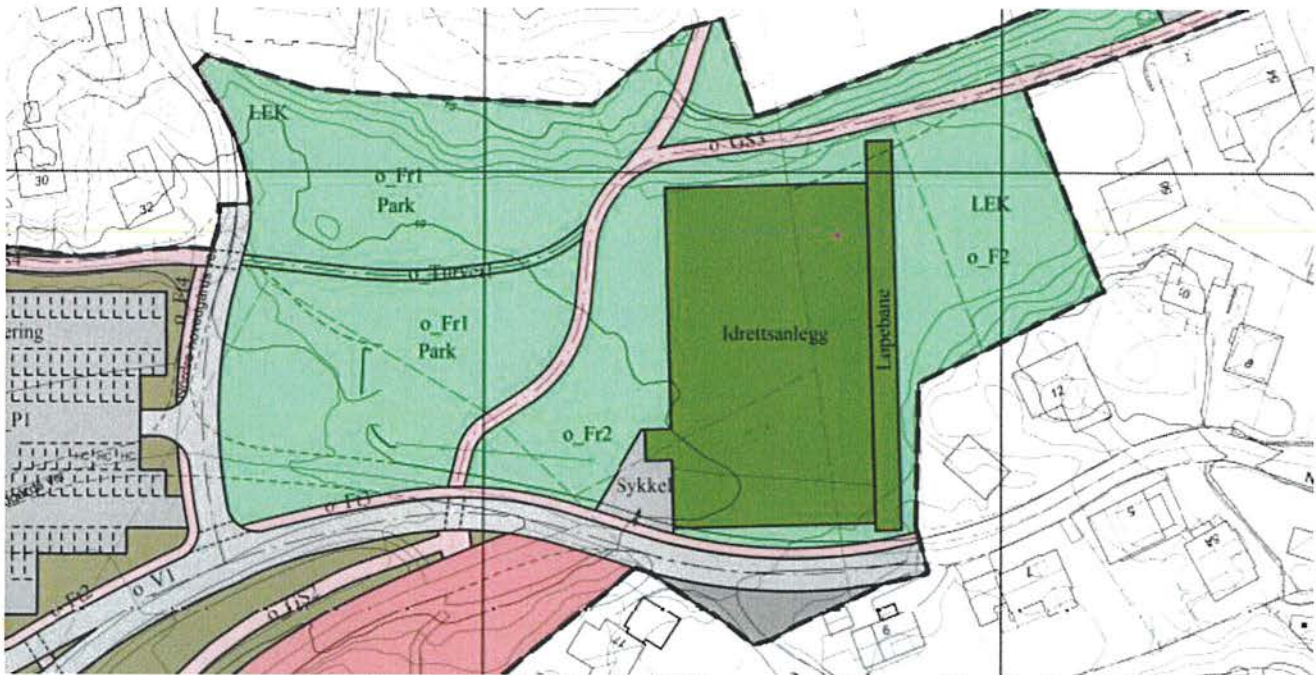
Utsnitt av reguleringsplanen for Vågsbygd skole/Vågsbygd kirke - område for nærmiljøpark plan id 1309