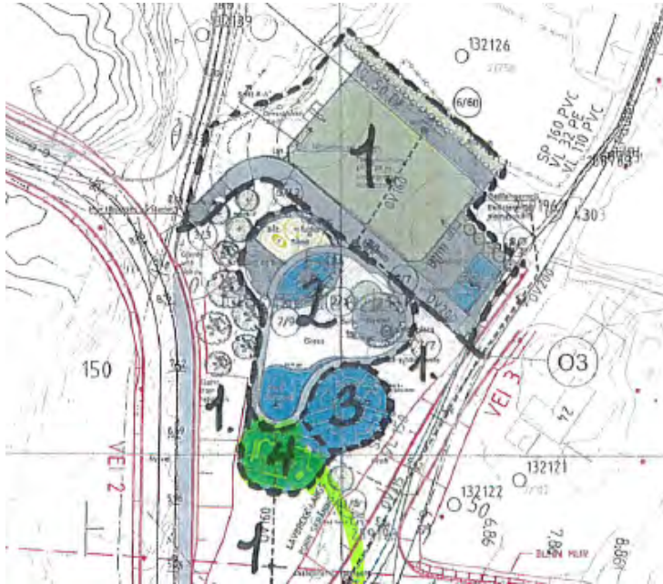
Figur 2. Friområde F1 i Paulen, inndeling i trinn.

Utbyggingsavtale for Brattesøy/Skålevik By- og stedsutviklingsdirektøren - avtaleutkast datert 26.08.2022