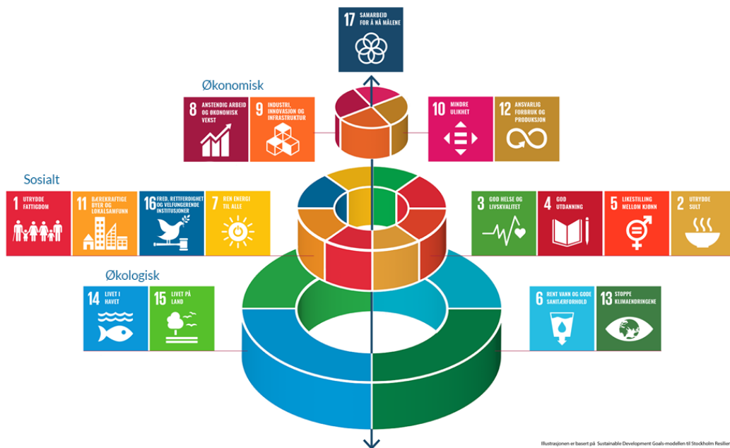
Fig 3: Økologisk, sosial og økonomisk utvikling kan ikke oppnås isolert fra hverandre, denne modellen av FNs bærekraftsmål viser sammenhengen mellom dimensjonene der økonomisk bærekraft er avhengig av at økologisk og sosial bærekraft er ivarettatt.

I en fremtid som krever omstilling kan kunst og kulturopplevelser få flere i arbeid. Kunst og kultur bidrar til å nå bærekraftsmålene ved å flytte fokus fra forbruk til opplevelser.